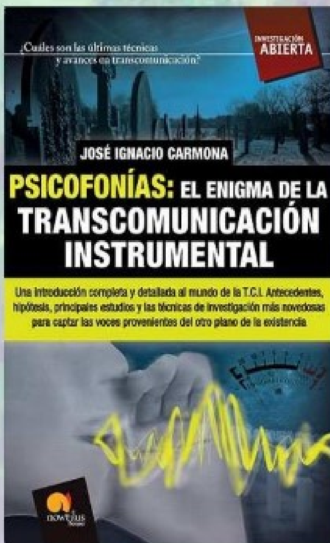
Portada del libro de José Ignacio Carmona

Fueron los árabes quienes influidos por la lógica aristotélica separaron y agruparon aquel concepto abstracto que en el mundo antiguo se tenía sobre el conocimiento, dividiéndolo en materia científica y no científica.