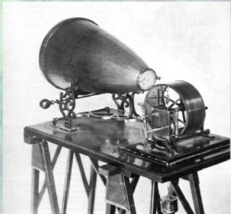
Fonocautógrafo de 1968

- El medico italiano experto en el cerebro Nitamo Montecuco experimento con 12 voluntarios observando como sin que hubiese ningún tipo de contacto sensorial entre ellos, y mediante un ejercicio de meditación en un momento dado los voluntarios terminan sincronizando sus ondas cerebrales, en otras palabras, se produce un fenómeno de "transferencia".