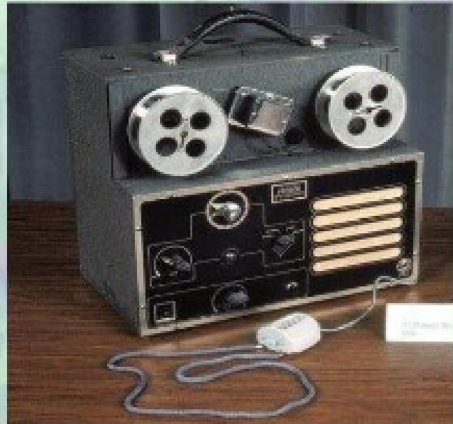
Magnetófono de alambre. La grabación se realizaba en un alambre que era magnetizado por la cabeza grabadora

Como podemos observar los sucesos paranormales y por ende las psicofonías, son tan solo un juego de niños en comparación con los descubrimientos científicos y seguramente respondan a interacciones extravagantes de nuestra portentosa mente en su relación con el entorno. No lo dude, los parapsicólogos han sido reemplazados por los Teóricos de Sistemas.